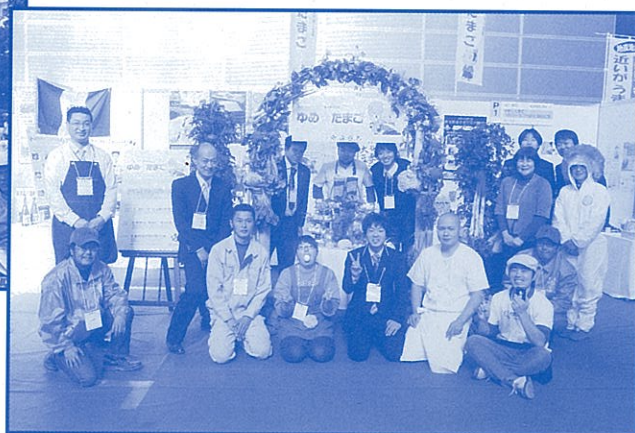
イベントでペルー料理を紹介した深谷市の産学官連携プロジェクト「ゆめ☆たまご」のメンバー（本誌14p）