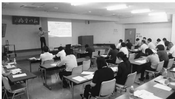
28.7.15 「PDCA実践研修会」(美里町) 美里町と当広域連合で共催し、獨協大学の 大谷基道先生による講義を実施