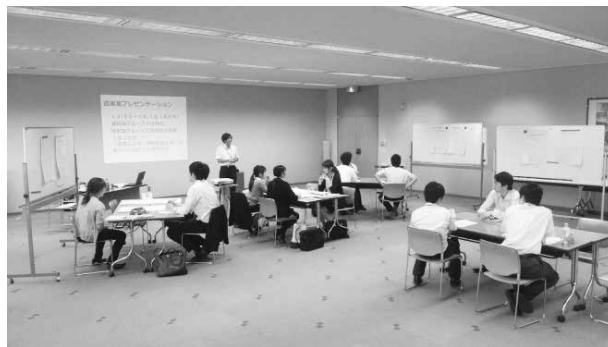
28.6.1～2 中級職員研修「行政課題討議」(入間市)