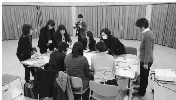
29.1.11 女性活躍推進P T「政策形成基礎」(宮代町)