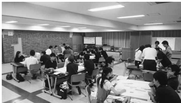
28.9.6 職員研修「政策形成基礎」(戸田市)