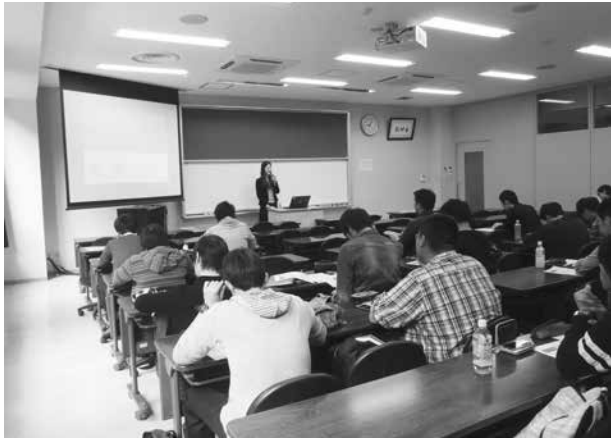
写真【寄附講座の様子】

ここまで紹介した3つの取組のほかにも、ゼミのフィールドとして戸田市を提供したり、インターンシップ実習生を受け入れたりするなど、大学側の要望にも応えてwin-winの関係を構築しています。