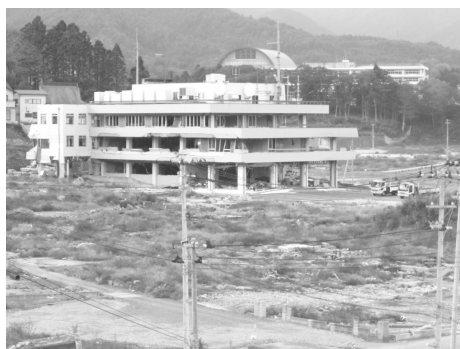
被災した女川町役場

東日本大震災を受けて、被災者支援の最前線を担う自治体は今後どうあるべきか。本報告書は、東日本大震災で改めて浮き彫りとなった課題を確認し、震災の教訓を活かす観点からその解決策を提言する。