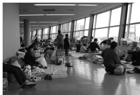
さいたまスーパーアリーナに開設された避難所の様子